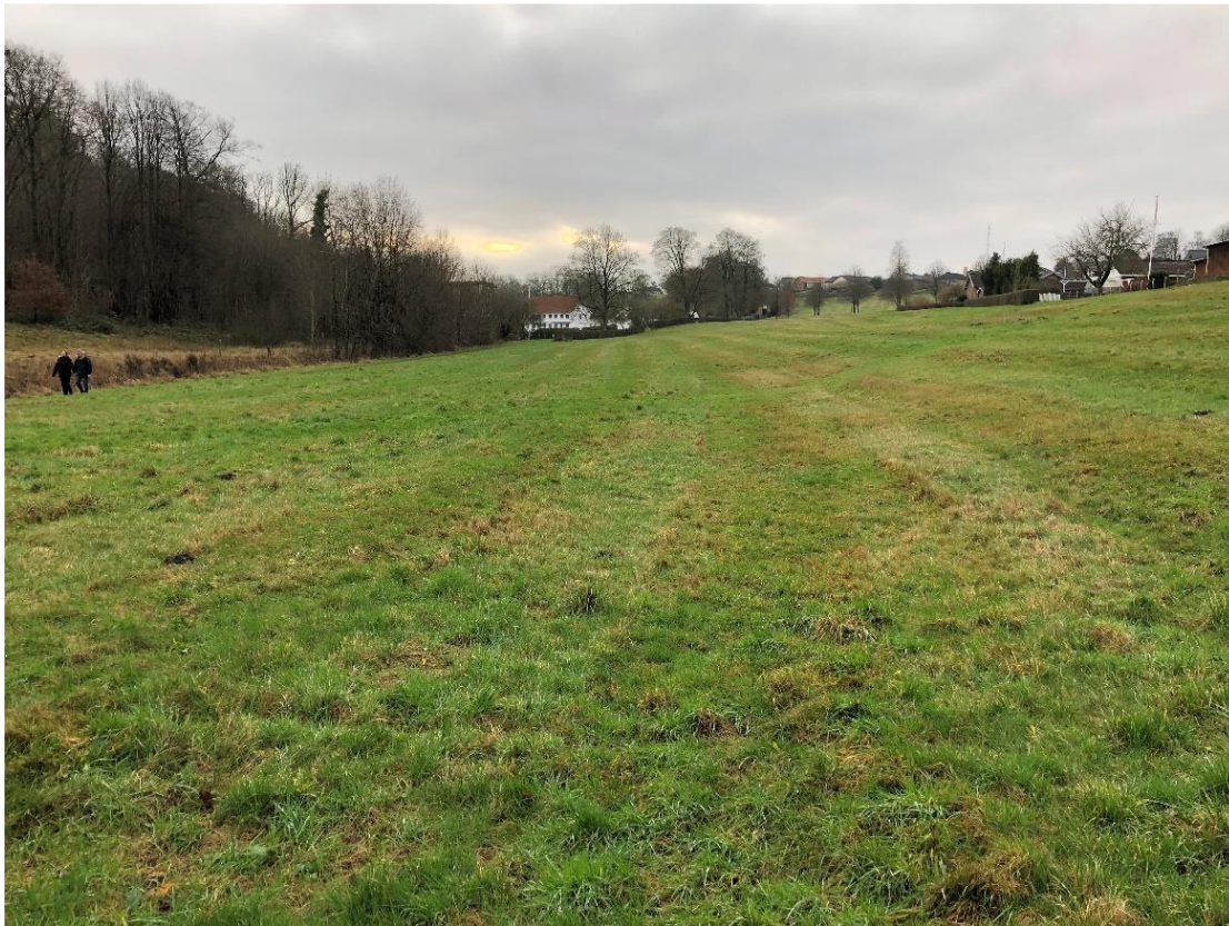
Foto fra arealet